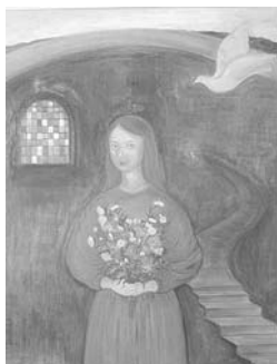
それでも生きていかなければならない