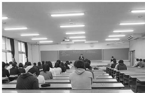
全国統一模擬試験の様子

そんな地域で頑張る社会福祉士を応援していきます。また、長野大学、社会福祉士養成校協会関東甲信越ブロック長野県支部とも共催し、全国統一模擬試験も行っています。