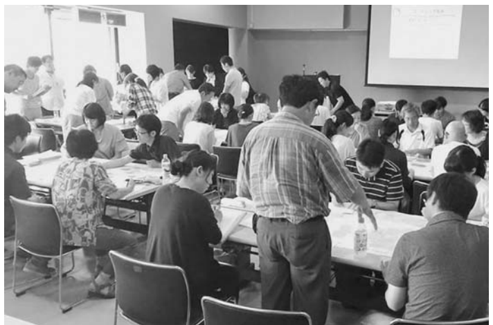
基礎研修Ⅰのようす ～熱い熱気が伝わります～

資質向上に向けた研修は、福祉活動委員会やばあとなあなどの各委員会によって、高齢や障がい、子ども、地域福祉などのそれぞれの分野を対象に研修会や勉強会が開催されています。この部会では、こうした分野を超えて例えば、相談援助技術など社会福祉士のスキルアップに必要な共通のテーマに絞った研修会を企画、運営していきます。