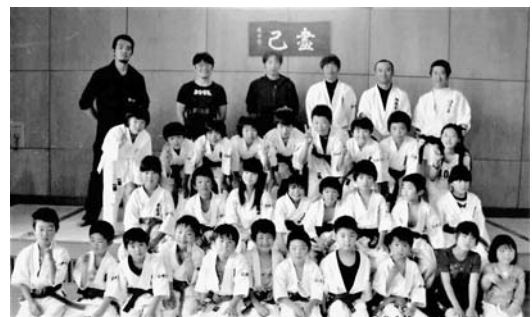
信濃町武道場にて夏合宿

私自身、これからも社会福祉士そして空手指導者として成長しながら子どもたちの未来に役に立てるように努めていきます。